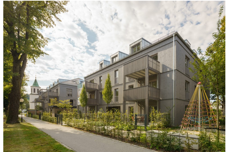
Ansicht von Nord-Ost Sebastian Schels, München

Landschaftsarchitektur Pangratz & Keil PartGmbH Landschaftsarchitekten Wolfgang Pangratz, Andreas Keil, München, https://pangratzundkeil.de/