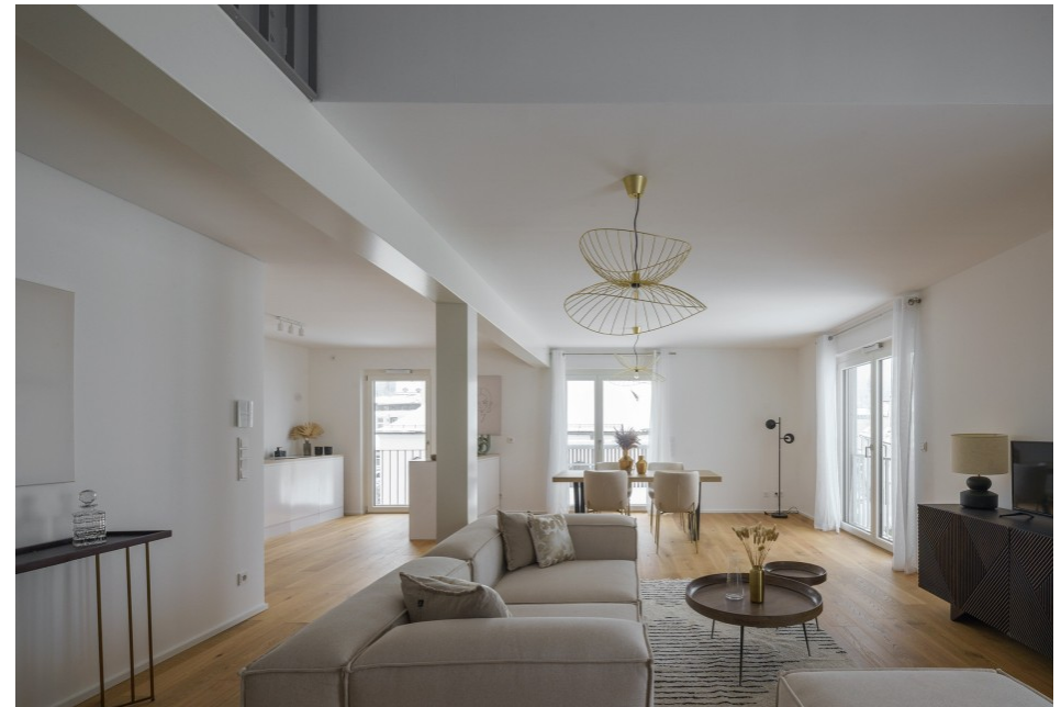
Innenansicht Maisonettewohnung 1 Sebastian Schels, München