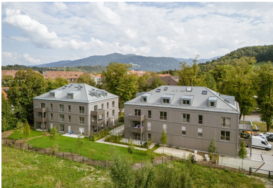
Ansicht Vogelperspektive von Südwest Sebastian Schels, München